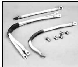
L4.83112.E Internal cable set man. 100-240 V Kabel-Set innen man. 100-240 V