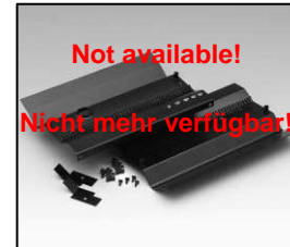
L4.83374.E Internal side baffle left + right Mantelstromblech links + rechts Not available! Nicht mehr verfügbar!