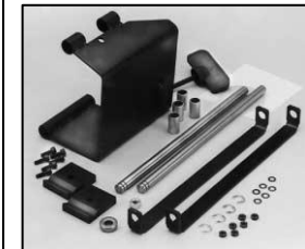
L4.83199.E Justable stirrup bracket set right Schwerpunktverstellung rechts