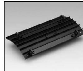
L4.83368.E Side extrusion right Rippenblech rechts