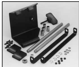
L4.83200.E Justable stirrup bracket set left Schwerpunktverstellung links