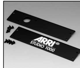
L4.83373.E Internal side baffle left + right Mantelstromblech links + rechts