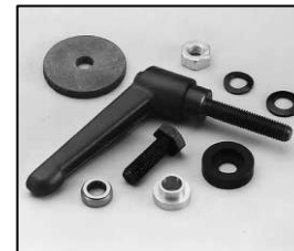
L4.83250.E Stirrup mounting set man. Bügelbefestigungs-Set man.