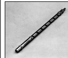
L4.83130.E Focus spindle Fokusspindel