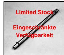
L4.83127.E Guide rail Leitspindel Limited Stock Eingeschränkte Verfügbarkeit