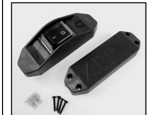
L4.77157.E In line switch 100-240 V man. Schalter 100-240 V man.