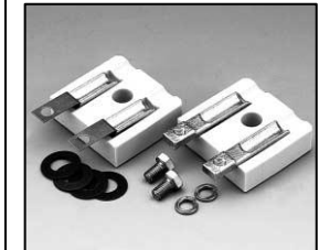
L4.83123.E Lampholder compl. Lampenfassung kpl.