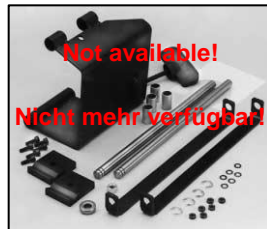
L4.83207.E Justable stirrup bracket set right f. motorized stirrup Schwerpunktverstellung rechts für motorisierte Bügel