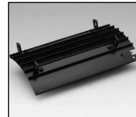
L4.83369.E Side extrusion left Rippenblech links