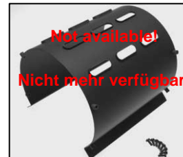
L4.74544.E Internal side baffle Mantelstromblech