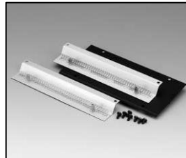
L4.83372.E Bottom panel Bodenblech