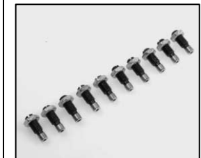
L4.80122.E 10 pcs. guide roll / focus 10 St. Führungsrollen / Fokus