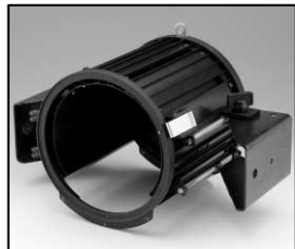
L4.83365.E Housing cpl. Gehäuse kpl.

NOTE: WHEN ORDERING QUOTE PART NUMBER | BEMERKUNG: BEI BESTELLUNG IDENT-NR ANGEBEN