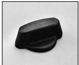
L4.81380.E Focus knob Fokusknopf