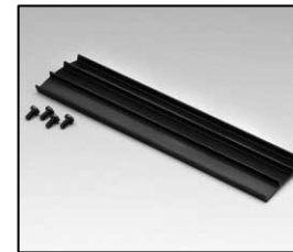
L4.83370.E Set of 3 extrusions, top Set 3 Rippenbleche, oben,