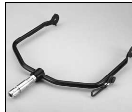
L4.83219.E Stirrup man. Haltebügel man.