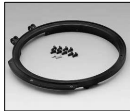
L4.83367.E Front casting black Frontteil schwarz