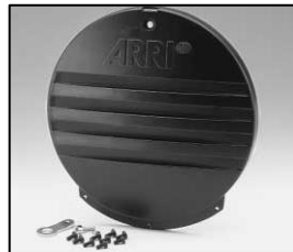
L4.83366.E Rear casting black Rückteil schwarz Haltering