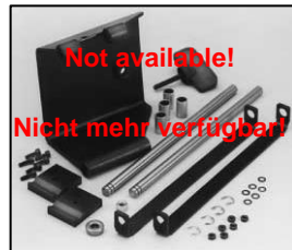
L4.83208.E Justable stirrup bracket set left f. motorized stirrup Schwerpunktverstellung links für motorisierte Bügeö