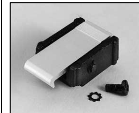
L4.79747.E Door catch set Schnapphaken Set