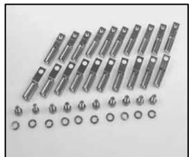
L4.80540.E Set of 10 pcs. lampholder contacts Set 10 St. Lampenklemmstücke