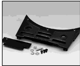
L4.83371.E Base casting Wannenstirnteil