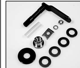
L4.80545.E Lamp lock shaft Hebel geschweißt