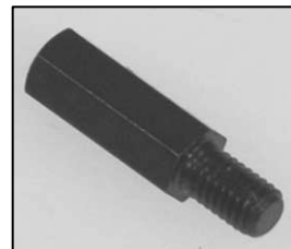
L4.80513.E Focus indicator Fokusanzeiger