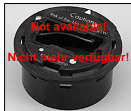
L4.72860.E Socket holder 21 W Trägerplatte 21 W