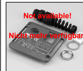
L4.72859.E Rear plate EBB Rückplatte EBB