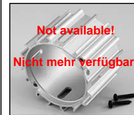
L4.72856.E Lamp housing Lampengehäuse