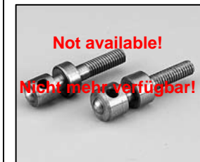
L4.72857.E Position pin set Führungsstift-Set