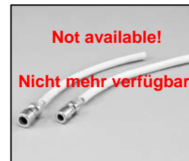
L4.72843.E Lamp holder set EBB Lampenfassungs-Set EBB