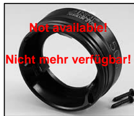
L4.72838.E Front ring 50 W Frontteil 50 W