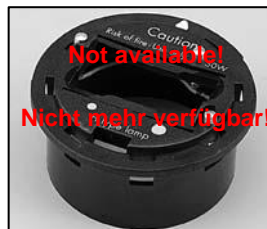
L4.72837.E Socket holder 50 W Trägerplatte 50 W