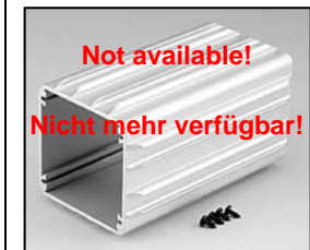
L4.72882.E Housing EBB Gehäuse EBB