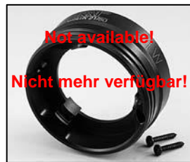
L4.72851.E Front ring 21 W Frontteil 21 W

NOTE: WHEN ORDERING QUOTE PART NUMBER | BEMERKUNG: BEI BESTELLUNG IDENT-NR ANGEBEN