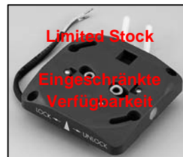
L4.72858.E Front plate EBB Frontplatte EBB