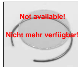
L4.72853.E Protection glass Sicherheitsglas