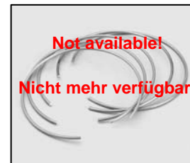
L4.72854.E Retaining ring 5 pieces Haltering 5 Stück